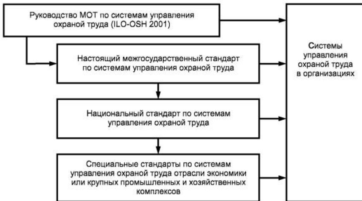
Рисунок 1 - Элементы национальных структур систем управления охраной труда

3.3.2 Элементы национальных структур управления охраной труда и связи между ними представлены на рисунке 1.